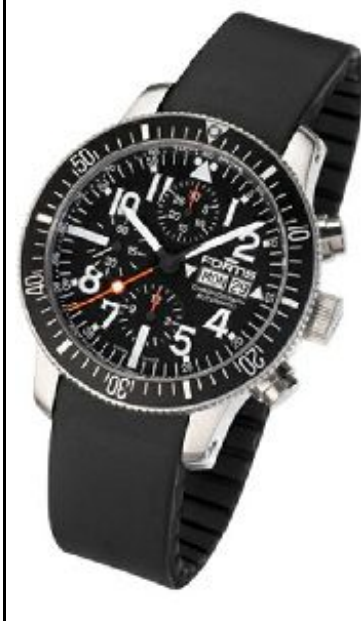
Fortis Marine Master Crono